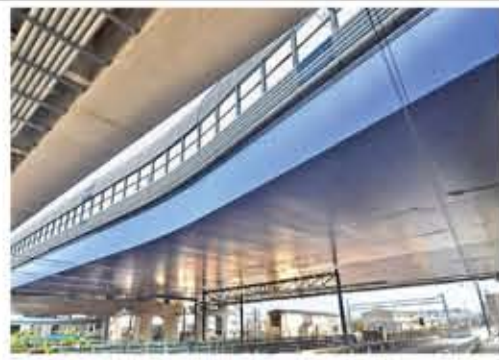
新日鉄住金エンジニアリングが採用されたNSカバールート (埼玉県川口市) 環境道の橋梁に採用されたNSカバールート (埼玉県川口市) 環境道の橋梁に採用されたNSカバールート (埼玉県川口市)...